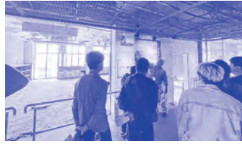
視察した荒浜小学校は海岸沿いにあり、校舎2階まで津波が達しました。

◆仙台被災地研修 4月13日(土)~14日(日)の日程で東日本大震災の被災地を視察しました。災害時でも事業の継続、早期再開を目的に防災等の意識醸成と被災地の取り組みを学びました。 視察した荒浜小学校は海岸沿いにあり、校舎2階まで津波が達しました。周辺が崩壊する中で当校では320名が避難し、助かっています。当時のままに保存されている箇所も多く、被害の甚大さを目の当たりにしました。今回の研修で学んだ内容を自社の事業継続並びに地域の防災に役立てていきます。